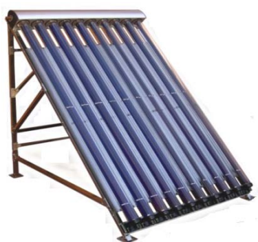
Solárny trubicový kolektor SES GM-10