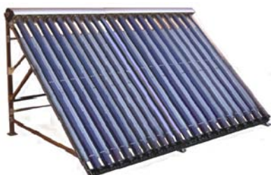
Solárny trubicový kolektor SES GM-20