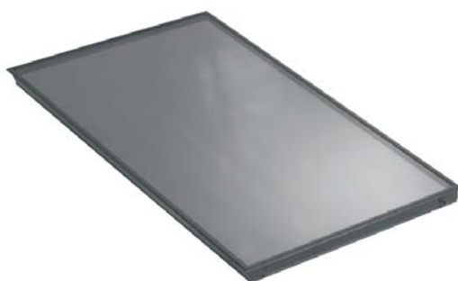
Plochý solárny kolektor SchucoSol K