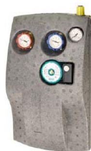
Solárna hydraulická jednotka