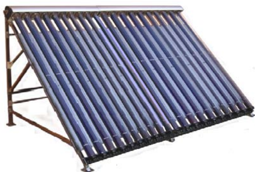
Solárny trubicový kolektor SES GM-20